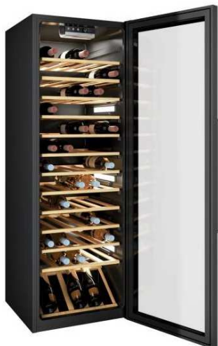
hladilna vitrina v KUH-1

naziv gradnje: VEČNAMENSKI DOM CERKLJE OB KRKI št. načrta: 22/22/08 - 0/1 - OPREMA