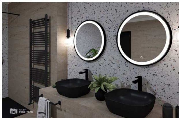
ogledalo z LED osvetlitvijo kot npr. CONCEPTO+ BELLA

visokotlačna armatura za umivalnik kot npr. VOXORT TEA BLACK mat črne barve