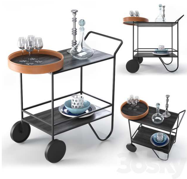
voziček GIRO, Calligaris