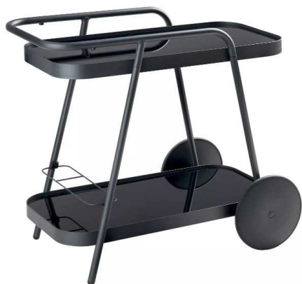
voziček ARJEN, Mömax