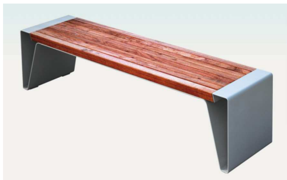
klop kot npr. Ziegler RADIUM, brez naslona, izvedba sedalne površine v tropskem lesu, stranski deli iz jeklene pločevine barvano v RAL 7016 dim. 200/42/44,5 cm