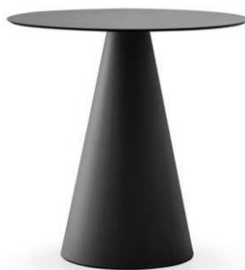
podnožje Pedrali IKON 865