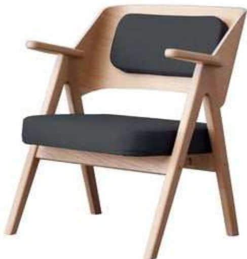
fotelj FINDAHL by Hammel Me Tube