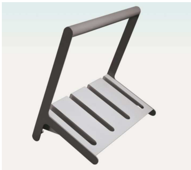
stojalo za kolesa kot npr. Ziegler VELO, enostranski, s 4 parkirnimi mesti iz jeklene pločevine, barvano v RAL 7016