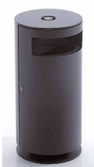
koš za smeti s pepelnikom kot npr. Ziegler CIMA, z vdelanim pepelnikom in držalom za vrečke iz jeklene pločevine, barvano v RAL 7016