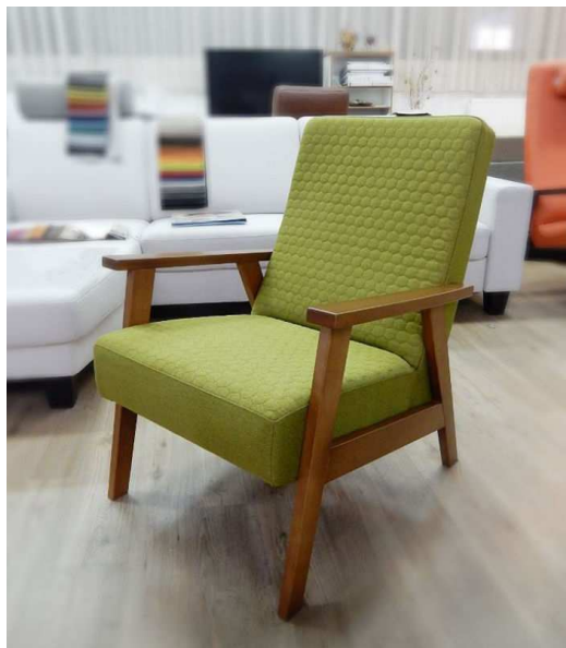
fotelj RETRO (M Tom)