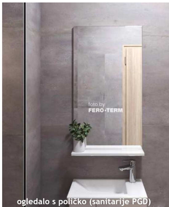
ogledalo s poličko (sanitarije PGD)