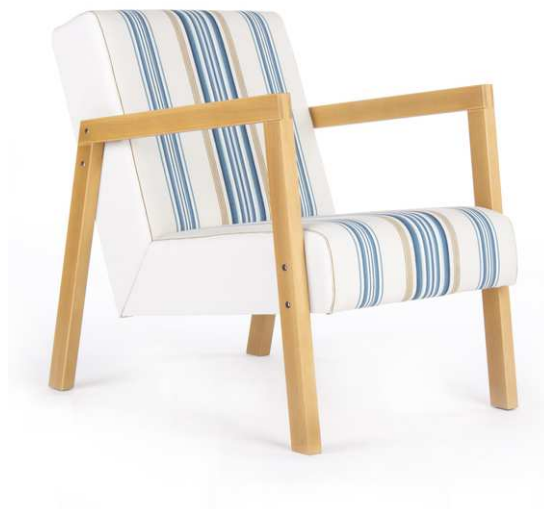
fotelj MIR (Kamenarič)