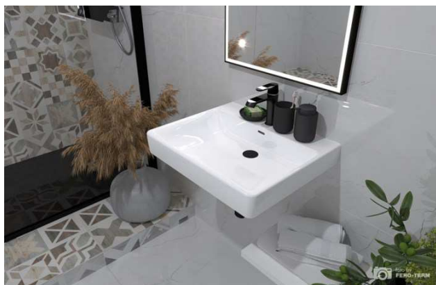
umivalnik kot npr. LAUFEN PRO S 55